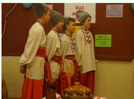
“З родини йде життя людини”

Свята проходять у нашій школі дуже цікаво. Ми торкаємося до народних обрядів, розширюємо свої знання про традиції українського народу. Ми маємо можливість проявити свої таланти, відчути себе акторами, артистами. Ці заходи сприяють духовному розвитку нас як особистостей.